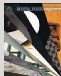
2006/2007 17 x 21 cm, 220 Seiten 150 Abb., 29,90 Euro