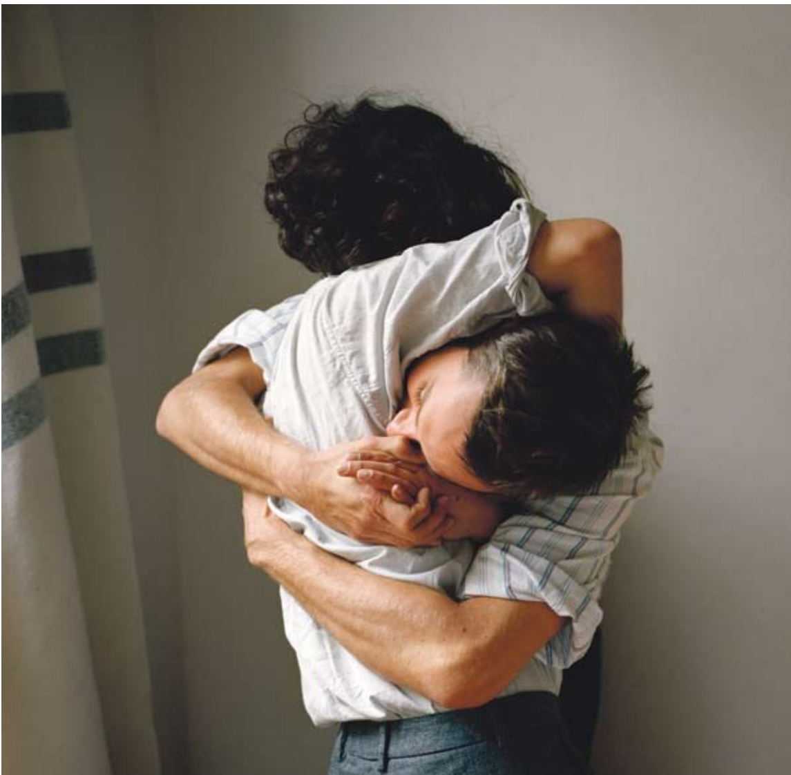
UTE KLEIN RESONANZGEFLECHTE - LEIBHAFTER RAUM RESONANT ENTANGLEMENT - BODILY SPACE