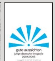
2004/2005 17 x 21 cm, 192 Seiten 220 Abb., 24,90 Euro