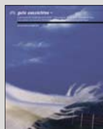
2007/2008 17 x 21 cm, 204 Seiten 349 Abb., 29,90 Euro