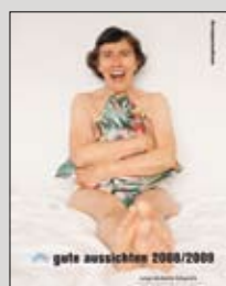
2008/2009 19 x 26 cm, 220 Seiten 304 Abb., 39,90 Euro