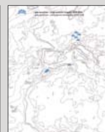
2005/2006 17 x 21 cm, 244 Seiten 148 Abb., 35,90 Euro