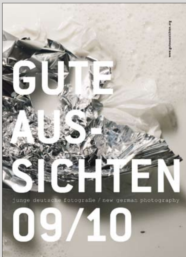
2009/2010 19 x 26 cm, ca. 200 Seiten, ca. 300 Abb., ca. 39,90 Euro ISBN 978-3-8391-7357-2

So klein wie ein Digklicki und immer ein Unikat: Unser Softbagchen "klicki" aus der Ausstellungsfahne für Berlin. Liebevoller Handarbeit vom Frauenprojekt Affentor, gefüttert, passt in jede Jackentasche, nur 17,90 Euro. Die Katalog-Bücher: 59 gute aussichten GewinnerInnen präsentiert auf über 1.250 Seiten.