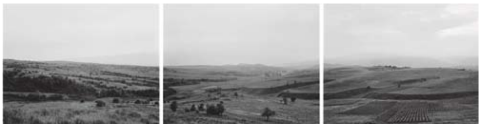
SHIGERU TAKATO OUR ELUSIVE COSMOS