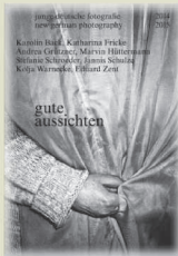
2014/2015 16,5 x 24 cm, 224 Seiten 320 Abb., 19,95 Euro ISBN 978-3-86490-226-0