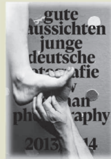
2013/2014 16 x 24 cm, 224 Seiten 320 Abb., 20,- Euro ISBN 978-3-86895-337-4