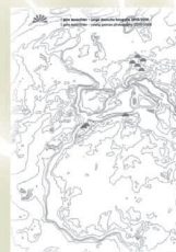
2005/2006 17 x 21 cm, 244 Seiten 148 Abb., 35,90 Euro ISBN 978-3-83343-080-0