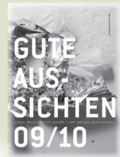
2009/2010 19 x 26 cm, 240 Seiten 293 Abb., 39,90 Euro ISBN 978-3-83917-357-2