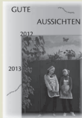
2012/2013 14,8 x 21 cm, 208 Seiten 300 Abb., 19,- Euro ISBN 978-3-941-263512