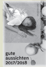
2017/2018 16,5 x 24 cm, 224 Seiten 373 Abb., 20,- Euro ISBN 978-3-9819355-0-9