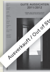
2011/2012 19 x 26 cm, 240 Seiten 300 Abb., 39,90 Euro ISBN 978-3-84485-289-9