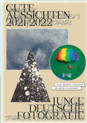
2021/2022 17 x 24 cm, ca. 224 Seiten ca. 360 Abb., 20,- € ISBN 978-3-9819355-5-4