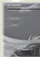
2007/2008 17 x 21 cm, 204 Seiten 349 Abb., 29,90 Euro ISBN 978-3-83348-743-9