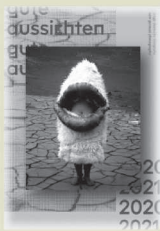
2020/2021 17 x 24 cm, 216 Seiten 360 Abb., 20,- Euro ISBN 978-3-9819355-4-7