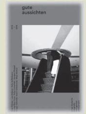
2015/2016 16,5 x 24 cm, 224 Seiten 350 Abb., 22,90 Euro ISBN 978-3-86490-341-0