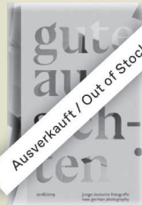
2018/2019 16,5 x 24 cm, 224 Seiten 400 Abb., 20,- Euro ISBN 978-3-9819355-2-3