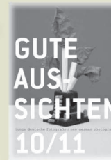
2010/2011 19 x 26 cm, 240 Seiten 300 Abb., 39,90 Euro ISBN 978-3-83919-602-1