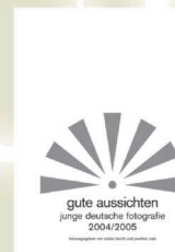
2004/2005 17 x 21 cm, 196 Seiten 190 Abb., 24,90 Euro ISBN 978-3-83342-213-3