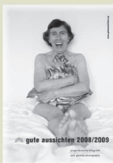
2008/2009 19 x 26 cm, 220 Seiten 304 Abb., 39,90 Euro ISBN 978-3-83704-875-9