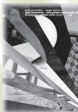
2006/2007 17 x 21 cm, 220 Seiten 154 Abb., 29,90 Euro ISBN 978-3-83346-484-3