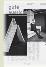
2016/2017 16,5 x 24 cm, 224 Seiten 381 Abb., 24,90 Euro ISBN 978-3-944874-54-8