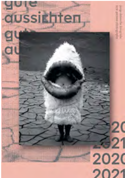
Das Cover des gute aussichten 2020/...

Neustadt/Weinstrasse, Dienstag, 7. April 2021