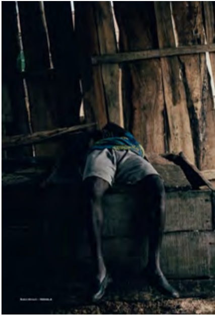
... wie dieser gute Mann aus Robin Hinschs Serie WAHALA

der Gegenwart". Hier bekommen Sie einen kleinen Vorgeschmack "auf das Ende der Kunst und die Zukunft der Künste", auf einen ebenso brillanten wie zeitgemässen Beitrag (PDF, 1,9 MB).