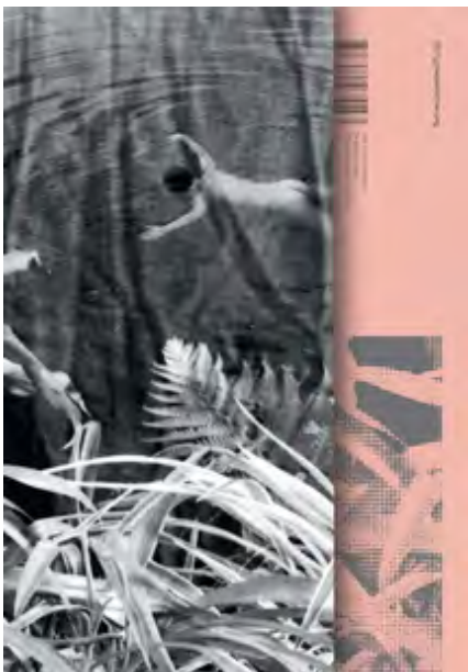
...der Rücktitel des Katalogs

Alle 18 gute aussichten Katalog-Bücher ( hier als PDF auf einen Blick ) präsentieren nun 148 gute aussichten-Fotograf/inn/en und ihre ausgezeichneten Werke, haben zusammen 3982 Seiten, über 5300 Abbildungen und kosten zusammen genau 467,85 Euro. Das ergibt einen Seitenpreis von noch nicht mal 12 Cent! Noch weniger für den Überblick über das Beste, was die junge deutsche Fotografie seit dem Jahr 2004 zu bieten hat, zahlen Sie noch nicht mal bei Zweitausendeins. Und wenn Sie noch glatte 10,- Euro drauflegen, bekommen Sie die 25 neuen, mehr als überraschenden gute aussichten DELUXE Positionen dazu!