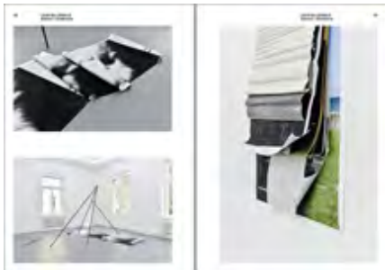
...Billerbecks Arbeit Ataxia/Ataraxia