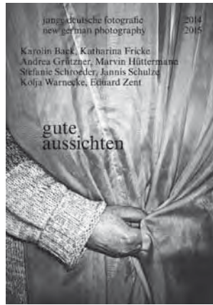
2014/2015 16,5 x 24 cm, 224 Seiten 330 Abb., 19,95 Euro ISBN 978-3-86490-226-0