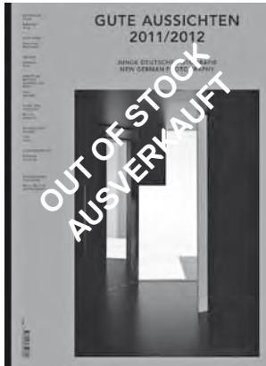
2011/2012 19 x 26 cm, 240 Seiten 300 Abb., 39,90 Euro ISBN 978-3-84485-289-9