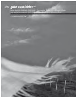
2007/2008 17 x 21 cm, 204 Seiten 349 Abb., 29,90 Euro ISBN 978-3-83348-743-9