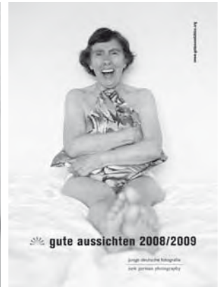
2008/2009 19 x 26 cm, 220 Seiten 304 Abb., 39,90 Euro ISBN 978-3-83704-875-9