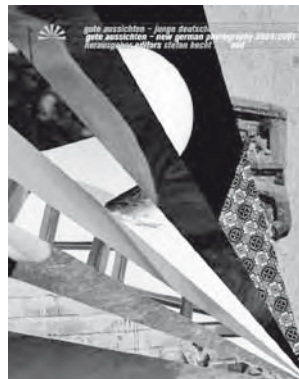
2006/2007 17 x 21 cm, 220 Seiten 154 Abb., 29,90 Euro ISBN 978-3-83346-484-3