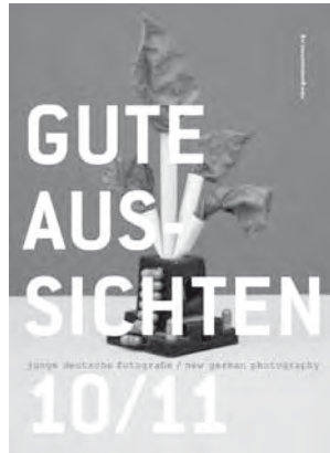
2010/2011 19 x 26 cm, 240 Seiten 300 Abb., 39,90 Euro ISBN 978-3-83919-602-1