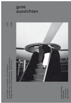
2015/2016 16,5 x 24 cm, 224 Seiten 350 Abb., 21,95 Euro ISBN 978-3-86490-341-0