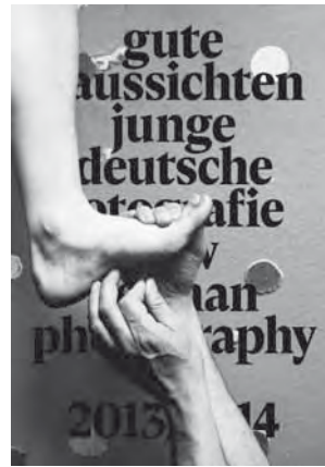
2013/2014 16 x 24 cm, 224 Seiten 320 Abb., 20,00 Euro ISBN 978-3-86895-337-4