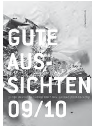
2009/2010 19 x 26 cm, 240 Seiten 293 Abb., 39,90 Euro ISBN 978-3-83917-357-2