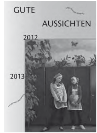
2012/2013 14,8 x 21 cm, 208 Seiten 300 Abb., 19,00 Euro ISBN 978-3-941-263512