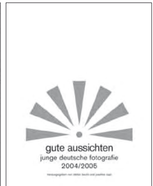
2004/2005 17 x 21 cm, 196 Seiten 190 Abb., 24,90 Euro ISBN 978-3-83342-213-3