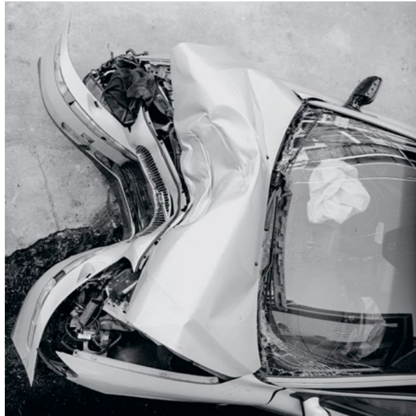
Liebe, Hass und Poesie: Kamil Sobolewski „Rattenkönig“ oszilliert in strengen schwarz/weiß Bildern zwischen Mythos und Realität ...