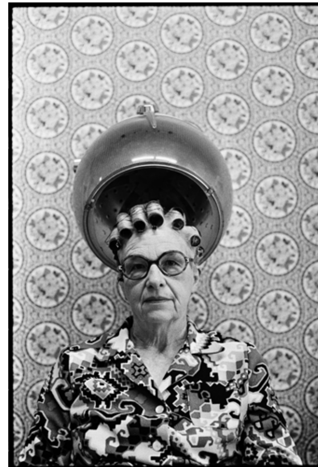
Ohne Titel, aus der Serie »Beim Friseur«, 1974