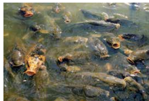
HOLGER JENSS Fall at Lake Victoria, 2018