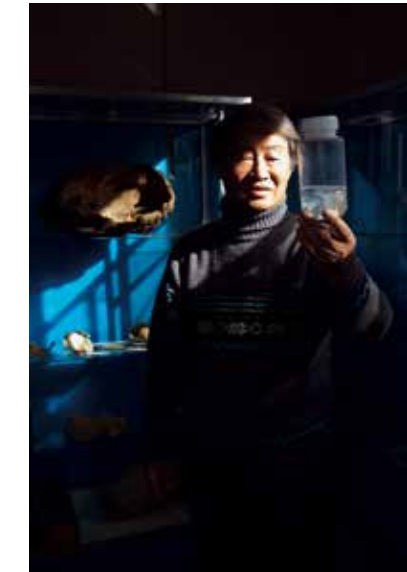
LAILA KALETTA A Dead Flower Will Never Bloom, 2018