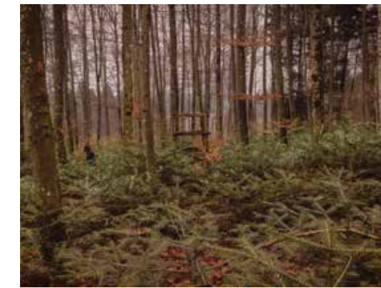
STEVE LUXEMBOURG Der Schatten, 2018