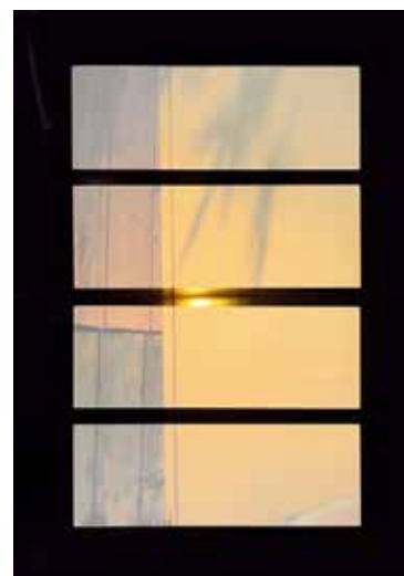
PATRICK KNUCHEL Die »Konkrete« Idee, 2017