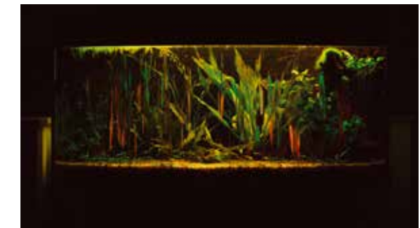
ROBERT TER HORST Playtime, 2018