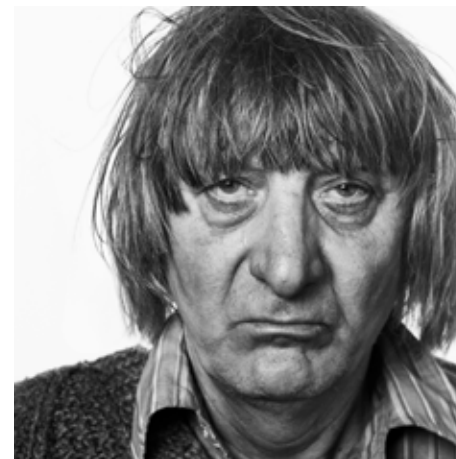
Selbstporträt »Mieses Gesicht«, 1998

MIT FREUNDLICHER UNTERSTÜTZUNG DEICHTORHALLEN FREUNDKREIS DES HAUSES DER PHOTOGRAPHIE HAMBURG