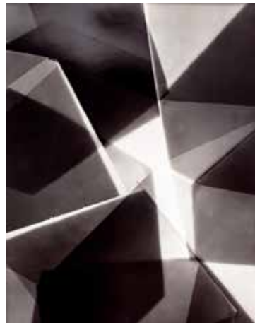
BENJAMIN KUMMER Konstruktion Raum, 2017