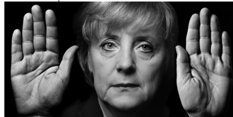
Angela Merkel, Bundeskanzlerin aus der Serie »Hände«, 2005