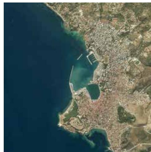
MALTE SÄNGER Abdrücke, 2018