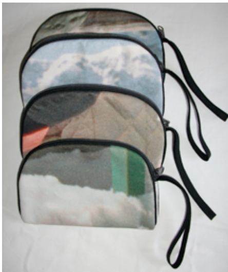
... jedes Exemplar ein Unikat, gefüttert, samtweich, mit Reissverschluss ...