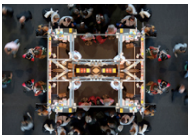
... oder konzentriert auf einen einzelnen Messestand- oder etwa doch zwei? (Alle Hallenfotos von Christian Hörder & Delia Keller)

Frankfurt/Main, Dienstag, den 2. September 2008