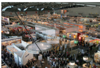
... und ein unverfälschter Blick in die Tiefen der Halle 3.1 ...