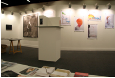
Der "gute aussichten" Hauptstand im Jahr 2007 in der Halle 5.0 ...