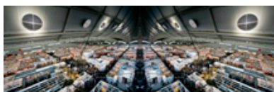
...digital zusammengesetzt sieht die Halle 3.1 "von oben" dann so aus ...