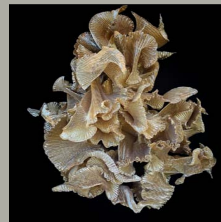
Die Textilkünstlerin Elke Walter kreiert aus erlesenen Stoffen skulpturale Objekte

Einladung Zur Eröffnung der Ausstellung gute aussichten heimspiel 9 am Samstag, den 5. Mai 2018 ab 15 Uhr mit Werken der gute aussichten Preisträger Nadja Bournonville & Aras Gökten und zur persönlichen Begegnung mit den jungen Fotografen laden wir Sie und Ihre Freunde herzlich ein.