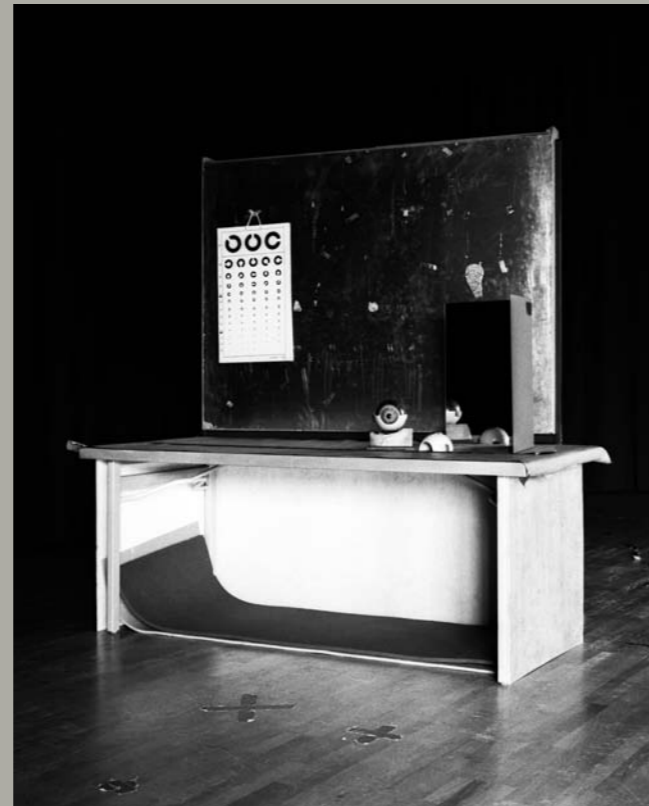
Nadja Bournonville stellt in „Blindfell“ nicht nur unsere wirkliche Sehfähigkeit auf den Prüfstand, sondern verführt uns, im wahrsten Sinn der Worte, über den optischen Tellerrand hinaus zu schauen

Das gute aussichten heimspiel 9 zeigt Werke aus den Serien „Blindfell“ (2015) von Nadja Bournonville und „Arkanum“ (2013/2014) von Aras Gökten .