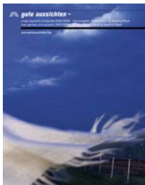
2007/2008 17 x 21 cm, 204 Seiten 349 Abb., 29,90 Euro