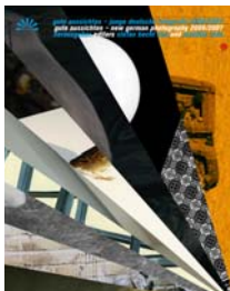
2006/2007 17 x 21 cm, 220 Seiten 150 Abb., 29,90 Euro