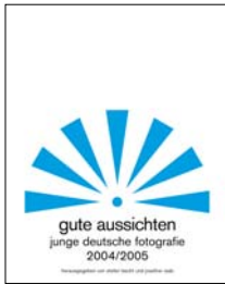
2004/2005 17 x 21 cm, 192 Seiten 220 Abb., 24,90 Euro