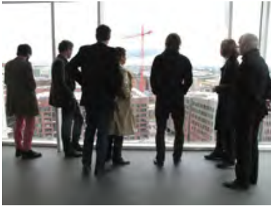
Die achtköpfige Jury 2011: Nur die schönen Rücken entzücken und ...