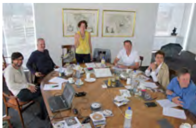
Die sechsköpfige Jury im Jahr 2012 bei der Arbeit ...