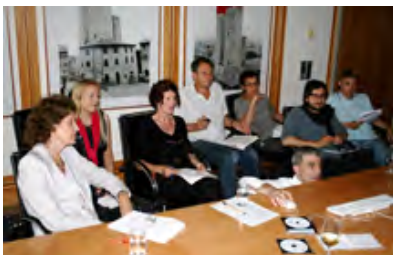
Wenn es eng wird - am Ende - rücken alle zusammen