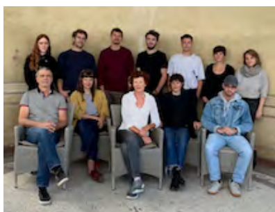
Die gute aussichten 2019/2020 Preisträger*innen