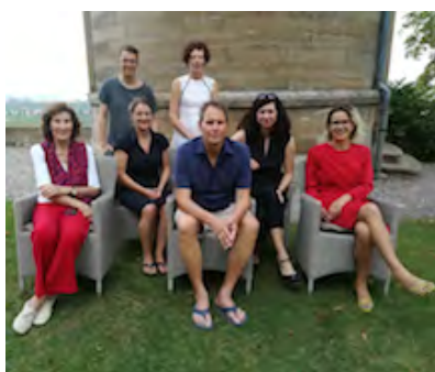
Die gute aussichten 2019/2020 Jury