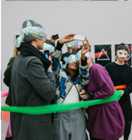
...die wissen: Fotografiert wird immer,...

Bitte ergänzen Sie bei Ihrer Einreichung Ihre Bilddaten um Ausstellungs- bzw. Installationsansichten . Filme, Videos, Sounds, Publikationen oder andere grosse Dateien können als Weblinks bei der Einreichung hinterlegt werden..