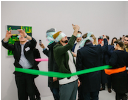
...überall, von allen, selbst im Dreh-Kreis mit verbundenen Augen

Zwingend ist, dass Sie Ihr Abschluss-Zertifikat als PDF oder Bild bei Ihrer Einreichung mit hochladen.