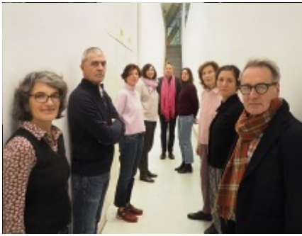
...auch bei der gute aussichten 2020/2021 Jury dabei waren und...

Weitere Informationen über gute aussichten und das, was in den 18 Jahren seines Bestehens für die Preisträger*innen und ihre Werke geleistet wurde, finden Sie in dem Factsheet " Was ist gute aussichten? " (PDF) und in unserem ausführlichen gute aussichten MANUAL II (PDF) am Ende dieser Seite.