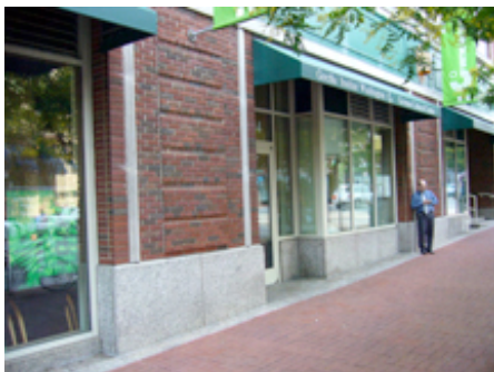
... und ab Mitte Juni 2010, in Auszügen, im Goethe-Institut Washington DC