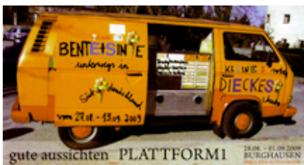
Einladungskarte zur "gute aussichten_plattform1", wie wir sehen, individuell umgestaltet von Sinje und ...