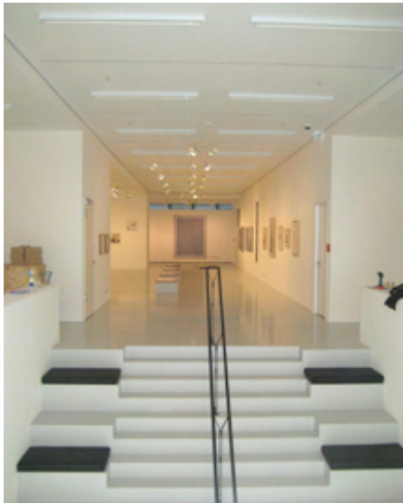
... ab 11. Juni 2010 im das Art Foyer DZ Bank in Frankfurt/Main ...