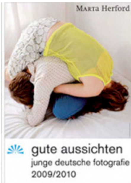
Hier gehts los: Plakat für die "gute aussichten 2009/2010" Auftakt-Ausstellung im Marta Herford ..

➔ AKTUELL ARCHIV PRESSEKIT PRESSESPIEGEL KONTAKT