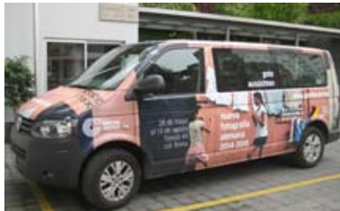
... auf den Strassen der Mega City