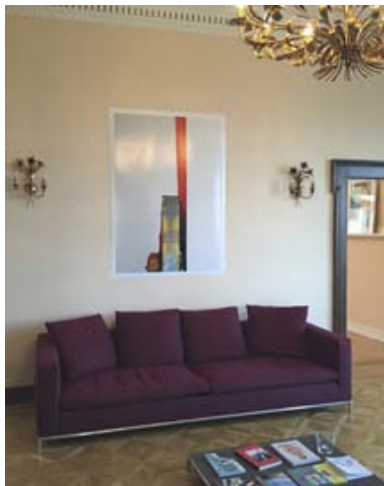
... und "Erbgericht"

Adress/e: Haardter Schloss, Mandelring 35, D-67433 Neustadt/Weinstraße, +49 (0)6321-970 67 99, www.guteaussichten.org . Öffnungszeiten: Nur nach Anmeldung, telefonisch: +49-(0)6321-970 67 99 oder via Mail info@guteaussichten.org .