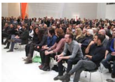
Eröffnung von gute aussichten