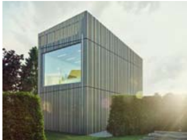
Schön und modern, modern schön: Das Haus für die Kunst von ...