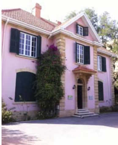
Das Goethe-Institut Nicosia auf Zypern

Adress/e: Deichtorstrasse 1-2, D-20095 Hamburg, Telefon +49 (0)40-32 10 30, www.deichtorhallen.de . Öffnungszeiten: Dienstag bis Sonntag 11-18 Uhr, jeden ersten Donnerstag im Monat 11-21 Uhr. Opening Hours: Tuesday to Sunday 11-6, first Thursday in the Month 11-9. Öffentliche Verkehrsmittel: Alle U-/S-Bahnen und Busse, die am HBF Hamburg halten. Local Traffic: All Metro-Lines and Busses Stop Hamburg Central Station.