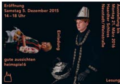
gute aussichten_heimspiel6 mit den Arbeiten "Moderne Tradition" ...