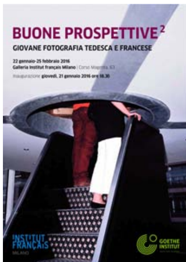
gute aussichten 2015/2016 in Mailand: Buono Prospettive

Adress/e: Goethe-Institut Mailand, Via San Paolo 10, I-20121 Milano, +39 02 77691733, www.goethe.de/mailand Adress/e, Ausstellungsort/ Exhibition place : Institut Français, Palazzo delle Stelline, Corso Magenta 63, I-20123 Milano, +39 02 48 59 19 27, www.institutfrancais-milano.com