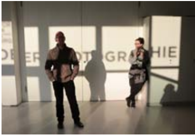
gute aussichten_plattform6 im Februar 2015 im Haus der Photographie, ...

der freundlichweise in die aktuellen Arbeiten und in das Projekt einführen wird. Weitere Informationen und die Einladung zur Ausstellung finden Sie hier.