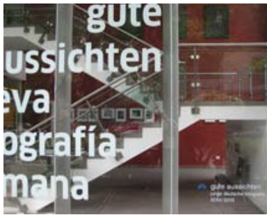
gute aussichten im Goethe-Institut Mexico City und via Instituts-Bus ...