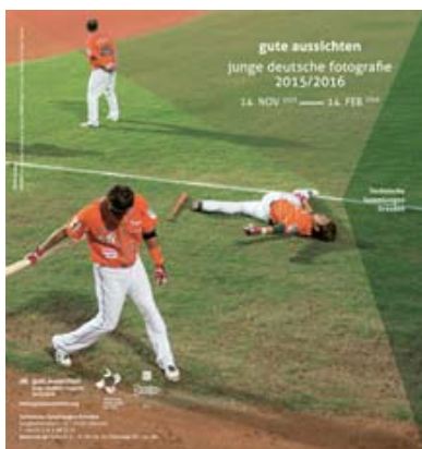
... von 13.11.15 bis 14.2.16 in den Technischen Sammlungen Dresden