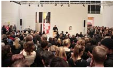
... der Photographie, Deichtorhallen, Hamburg