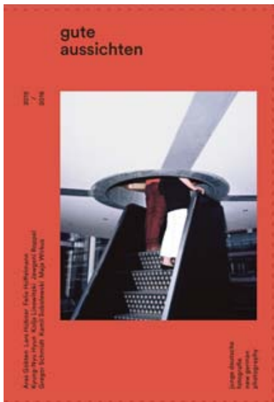
gute aussichten 2015/2016 Katalog