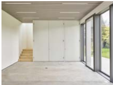
... widmertheodoridis in Eschlikon